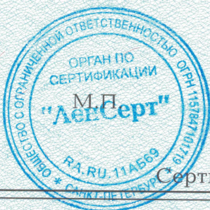
Схема сертификации Зс.